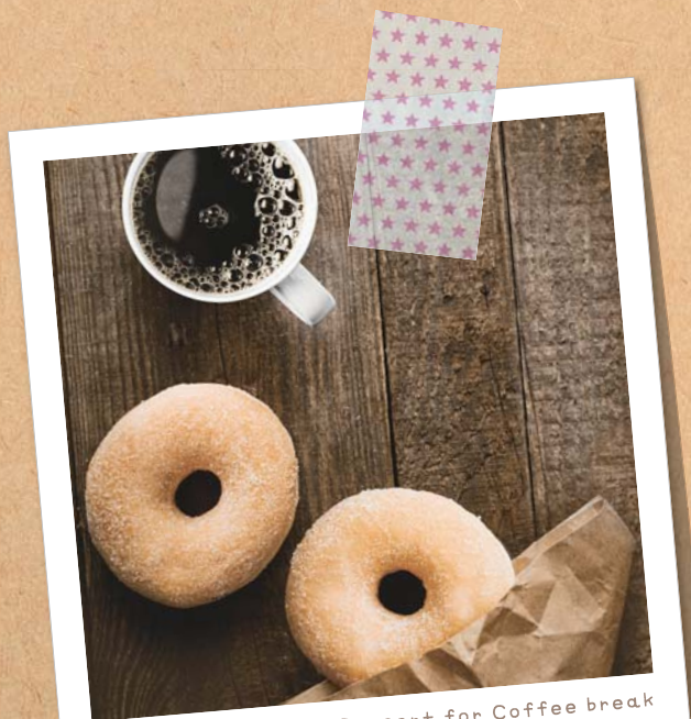
Dessert for Coffee break