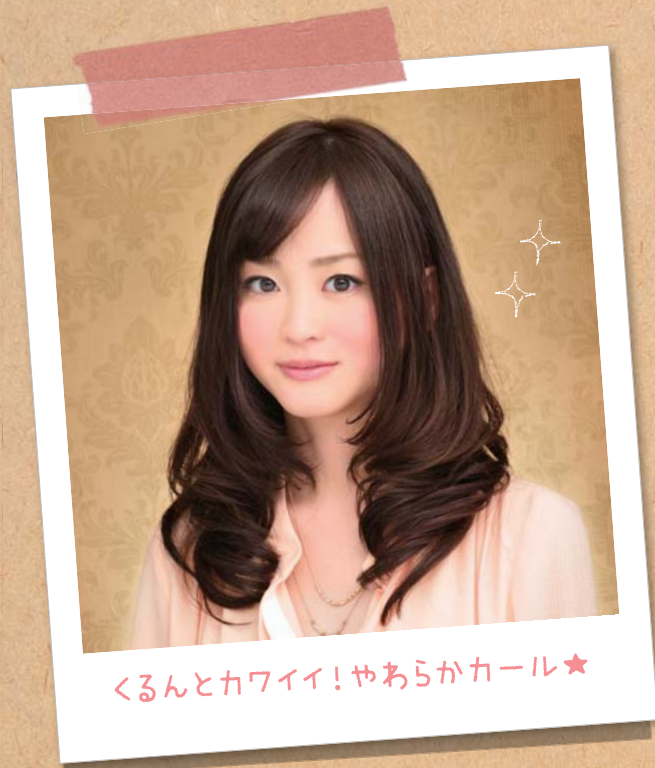
くるんとカワイイ! やあらかカール★