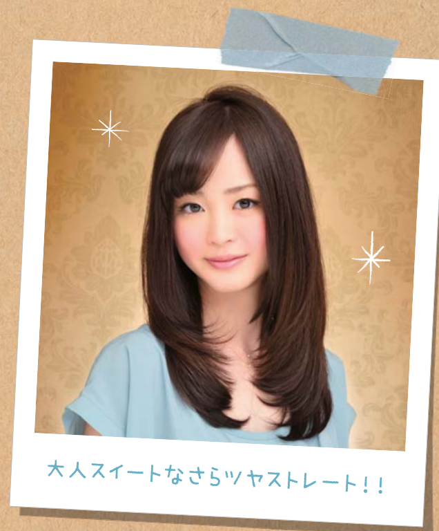
大人スイートなさらツヤストレート!!