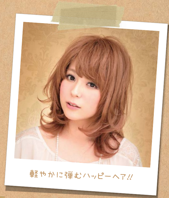
軽やかに弾むハッピーヘア!!