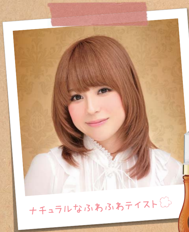
ナチュラルなふわふわテイスト