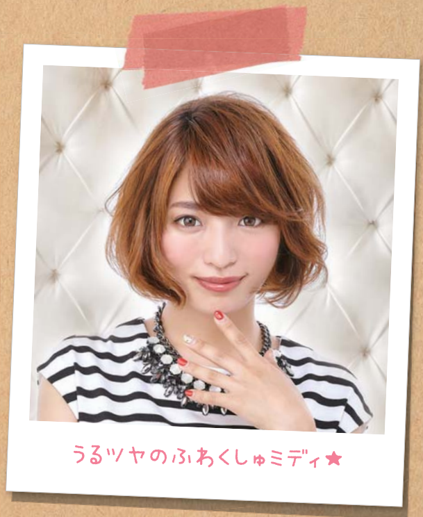
うるツヤのふあくしゅミディ★