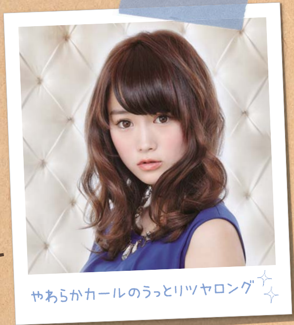
やあらかカールのうっとリツヤロング ✨