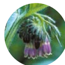
コンフリー葉エキス