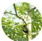
タペブイアインパチギノサ 樹皮エキス