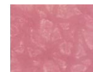
炎症を起こした肌